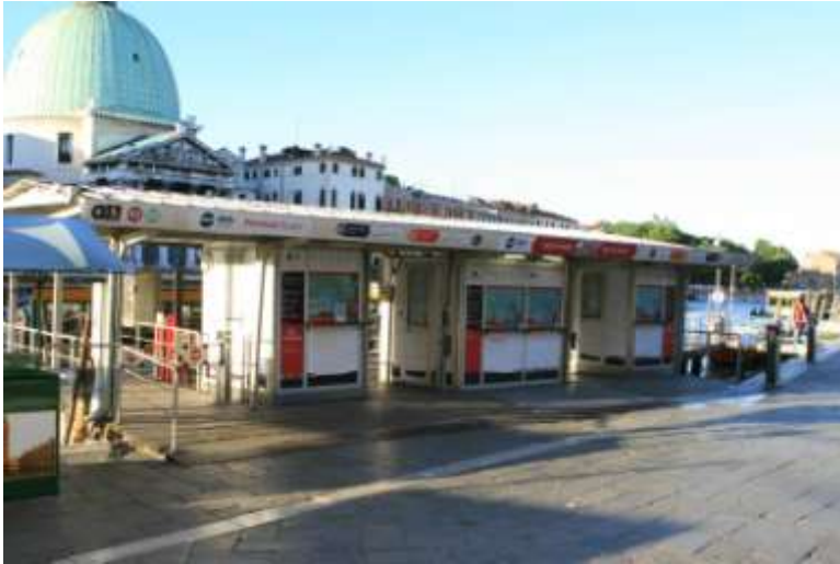
“Scalzi” Railway stn. ticket office