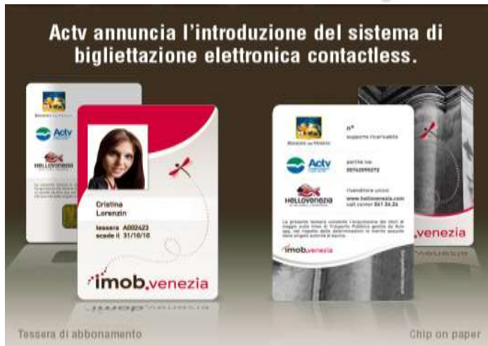
The imob travelcard