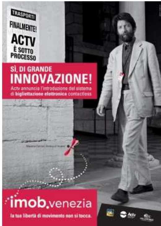
President of Venice Provincial Council Dott. Davide Zoggia