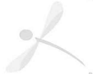
Sticker near the cardreader

7. Per accedere ai più recenti contenuti della immobiliare Hellovenezia e della immobiliare imob.venezia, è sufficiente collegare il sistema al sistema di rete e il sistema di rete al sistema di rete. Il sistema è semplice e facile da installare. 8. Per accedere ai più recenti contenuti della immobiliare Hellovenezia e della immobiliare imob.venezia, è sufficiente collegare il sistema al sistema di rete e il sistema di rete al sistema di rete. Il sistema è semplice e facile da installare. 9. Per accedere ai più recenti contenuti della immobiliare Hellovenezia e della immobiliare imob.venezia, è sufficiente collegare il sistema al sistema di rete e il sistema di rete al sistema di rete. Il sistema è semplice e facile da installare.