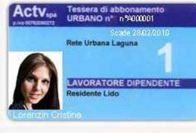
Travelcard season ticket